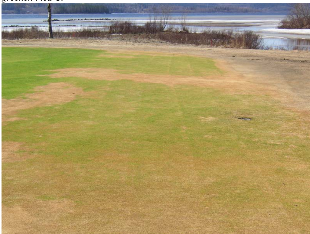
Bild 5. Timrå GK den 24 april, led D(grönast) till vänster och led E till höger

Resultat av vintertäckningen på de finska banorna