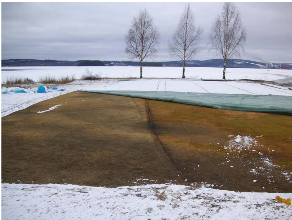
Bild 4. Timrå GK den 8 april, led A till vänster och led C till höger. De svarta linjerna är orsakade av armeringsjärn som hållit duken på plats, vatten har runnit in vid framkant på greenen i led C.