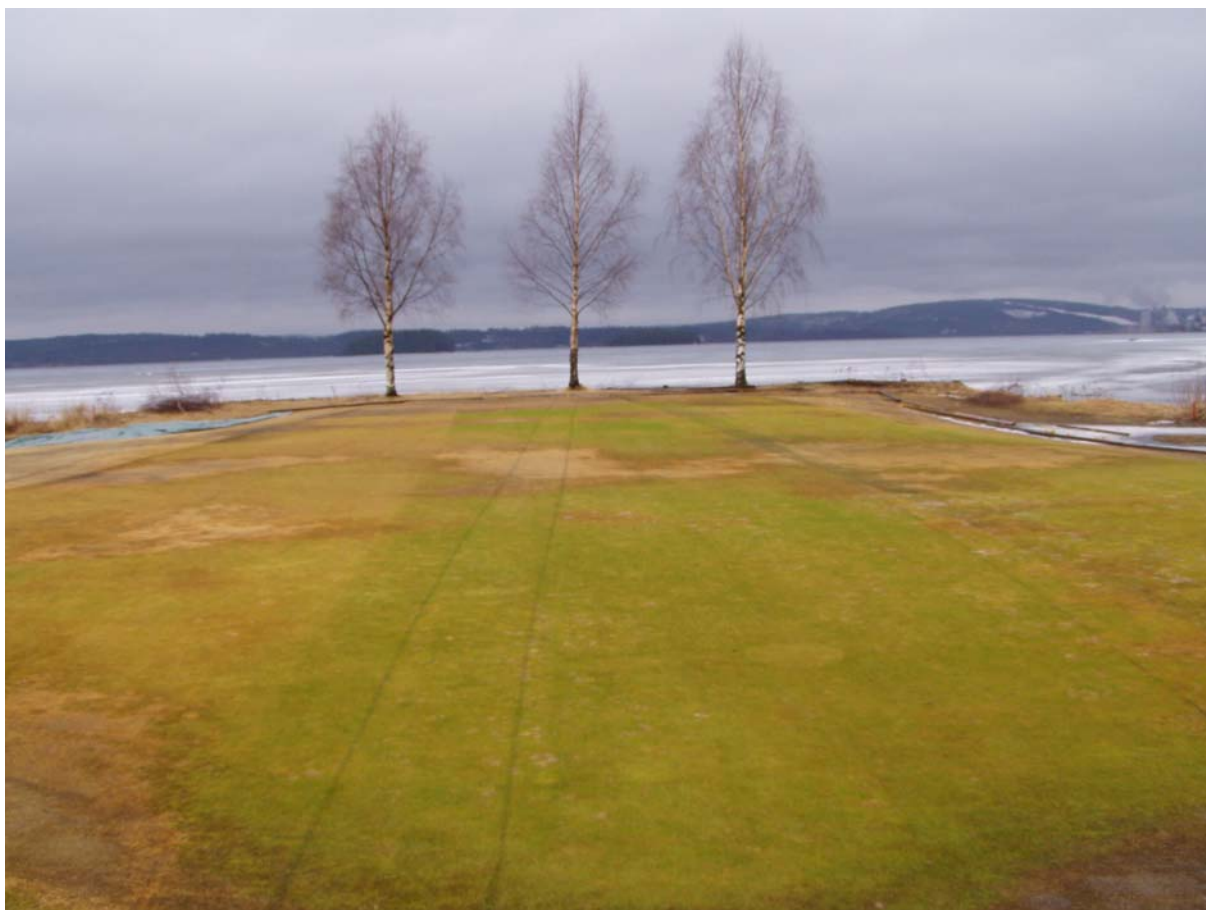
Bild 3. 31 mars 2008 på Timrå GK. Led C längst till vänster, mitt i bild led D och längst till höger led E. I bakre kant ses led B (mellan björk 1 och 2 till vänster) och längst till vänster skymtar en del av led A. I lågpunkter samt mellan vissa led har vatten runnit in och orsakat skada..

Dataloggers som mäter temperaturen var utlagda i försöket, men flera av dessa gick tyvärr inte att avläsa p.g.a. att vatten kommit in i batteriet. Men av de loggers som fungerade sågs små skillnader i temperatur mellan de olika leden, trots att det periodvist varit ner mot -25^{\circ}\text{C} och lite med snö (i Timrå) som isolerat. Utifrån det faktumet anser jag att man kan dra slutsatsen att ett isolerande skikt vid täckning inte nödvändigtvis behövs i syfte att skydda mot för låga temperaturer. Däremot sågs skillnader i färg ("grönast") i ledet med bubbelplast, något som sannolikt kan härledas till en bättre syretillgång under duken. Utifrån detta resonemang så har vi som jobbar med försöken beslutat att till kommande vinter jobba ännu mer med en tydlig luftspalt för att se om det handlar om att en del av leden dör p.g.a. syrebrist.