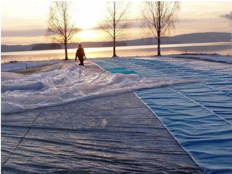
Bild 1. Timrå GK den 21 november 2007. Arbete med täckning,

Regn och snöblandat regn under början och mitten av november orsakade problem med kemisk bekämpning och klubbarna blev tvungna att skotta av greenerna innan täckningen. Det var allt annat än optimala förhållanden, men vi valde ändå att täcka greenerna trots att det inte gick att spruta förebyggande mot svamp. Greenerna täcktes mellan den 15 och 21 november på de båda klubbarna, se bild 1. Dukarna togs bort i slutet av mars till början av april på Timrå GK medan det dröjde till i början av maj tills snön smält på Bodens GK.