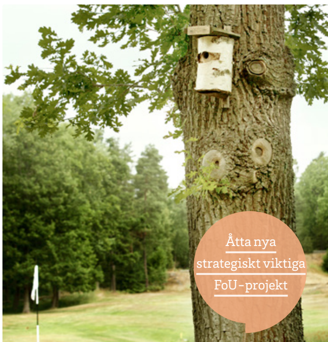
Åtta nya strategiskt viktiga FoU-projekt

SGF:s tävlingsstrategi ska spegla kravprofilen och utvecklingstrappan för alla åldrar. Att svenska talanger på herr- och damsidan har möjlighet att både se, och senare spela, en svensk europatourtävling har länge varit en del i tävlingsstrategin. Efter fem års uppehåll då det senast spelades en ET-tävling för damer i Sverige tillkom Helsingborg Open 2013, som ett resultat av långt och mödosamt arbete av SGF. Tävlingen blev väldigt lyckad och tillsammans med Helsingborgs kommun och Vasatorps GK blev det direkt en favorittävling för spelarna.