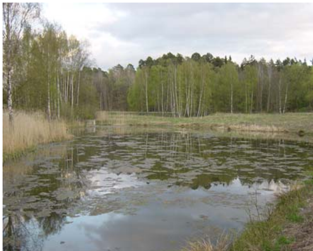
BILD 4. Banskötsel med höga givor närsalter kan göra dammarna på golfbanan direkt otjänliga för våtmarksberoende organismer. På bilden syns kraftig algbloomning som täcker dammens yta.

Långt ifrån alla svenska golfbanor är dock groddjursvänliga. I synnerhet om de inte uppfyller de tre kraven ovan. Dessutom kan en banskötsel med höga givor närsalter göra dammarna och andra habitat på golfbanan direkt otjänliga för de våtmarksberoende organismerna. Förhöjd halt av närsalter (eutrofiering) gör att endast ett fåtal vattenlevande smädjur gynnas på andra, känsligare arters bekostnad.