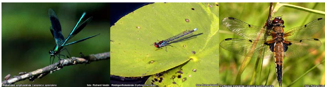
BILD 5. Det finns tre grupper trollsländor i Sverige: Jungfrusländor, flicksländor och äkta trollsländor. I vårt land finns bara två arter av jungfrusländorna som oftast håller till vid bäckar och rinnande vatten. Flicksländorna är betydligt vanligare och återfinns vid sjöar och dammar. Det finns flera arter i olika färger. Hanarna är oftast blå med svarta teckningar emedan honorna har liknande teckningar fast med brungrön bakgrundsfärg.

Av världens omkring 5000 trollsländearter, har man i Sverige funnit 61 arter. Då många europeiska trollsländor till följd av ett förändrat klimat expanderar sina utbredningsområden norrut, är det bara en tidsfråga innan fler arter upptäcks i vårt land. Av Europas cirka 164 arter är över en tredjedel hotade, primärt som en följd av att deras livsmiljöer försvinner.