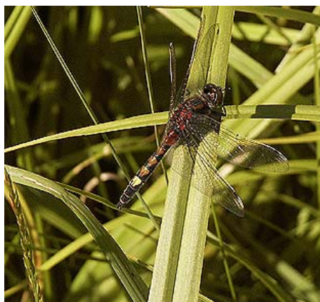
BILD 6. Inventeringen av dammar i stor-Stockholm visade bland annat att golfbanornas dammar hyser flera arter av trollsländor. Bilden visar en hane av den citronfläckade kärtrösländan som trivs i många golfbanedammar. Arten är fridlyst inom hela EU, men är inte rödlistad i Sverige. I Västeuropa har citronfläckad kärtröslända gått starkt tillbaka, troligen på grund av ökat kvävenedfall och markexploatering. Därmed har Sverige ett särskilt ansvar för artens fortlevnad.

larven är tämligen lik den vuxna sländan och saknar puppstadium vilket gör att det vuxna djuret kläcks direkt ur det sista larvstadiet.