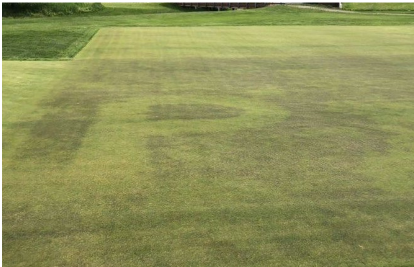
Bild 1: Vid fosforbrist blir plantorna violetta