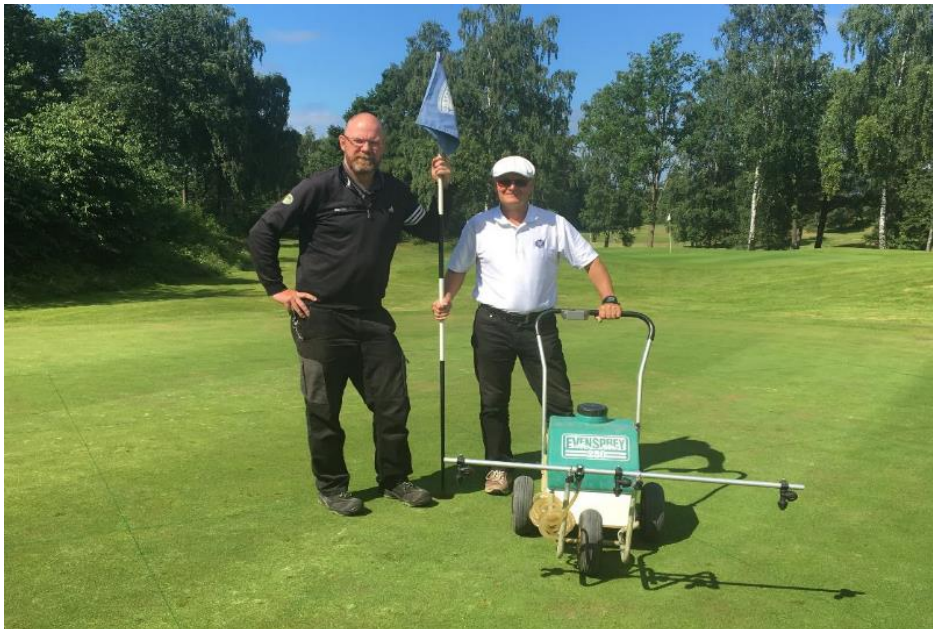
Figur 2: På bland annat Falkenberg Golfklubb testas MLSN-normen i Susphos-projektet

De samlade resultaten visar så här långt att det är små skillnader men på flera ställen, bland annat på Falkenberg Golfklubb, är det en tendens till att fosforgödsling leder till mer Poa annua .