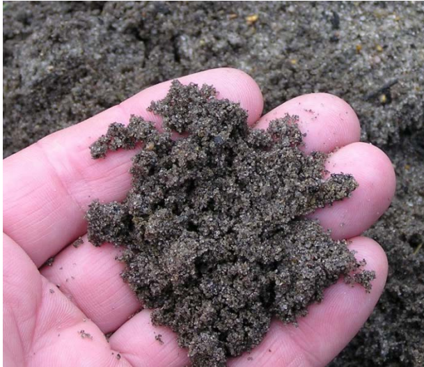
Bild 2. Mulldress (dress med organiskt material) ger bättre gröningsfuktighet där det är lite fult.

Torra förhållanden i översta skiktet ger stora utmaningar. De flesta vätmedel minskar fuktigheten i översta delen av markprofilen. Vätmedel kan vara bra att använda när växtmassan är hydrofob.