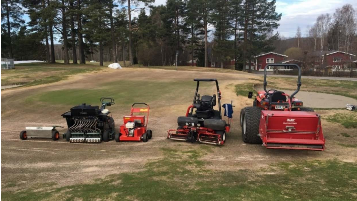
Bild 3. Test av såmaskiner på Sundsvall GK 3 maj 2016.

När vinterskador förekommer i små fläckar, ofta orsakade av snömögel, kan det vara kostnadseffektivt att så för hand. Det ger också det bästa resultatet.