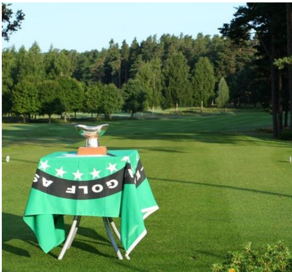
EM-pokalen på tee 1

Till EM 2013 var 19 lag anmälda. Varje lag bestod av sex spelare samt ledare. Lagen fanns hos Linköpings GK mellan 6 – 13 juli 2013. Tävligen började med två dagars slagspel som fungerade som kval där samtliga spelare i laget spelade. Varje dag valde man de 5 bästa scorerna. Efter två dagar gick de 8 bästa lagen vidare till slutspel och gjorde upp om platserna 1 - 8. Övriga lag gjorde upp om platserna 9 – 16. Slutspelet avgjordes genom matchspel där man spelade 36 hål om dagen, foursome på förmiddagen och singel på eftermiddagen. Linköping GK fick möjligheten att visa den fina banan för cirka 120 spelare och övriga från hela Europa. Tyvärr så regnade den andra dagen bort i tävlingen och man fick gå efter resultatet ifrån dag ett om vilka åtta lag som skulle få göra upp om medaljerna.