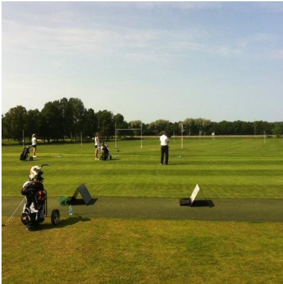
Nylagd grästee på drivingrange

Förberedelserna på banan började redan 2011 då tee på hål nr ett byggdes om. Detta gjordes med anledning av att tee var ojämnt och gav ett relativt dåligt första intryck av banan. Vi banarbetare torvade av det som var ojämnt och jämnade till det med USGA-material samt utökade damtee med ca 20 meter. Vi valde att lägga färdigräs och i juni 2012 var tee spelklar igen. Även en del av tee på hål nr 8 torvades av och jämnades till på samma tillvägagångssätt. Enda skillnaden var att det avtorvade gräset på åttans tee kunde användas igen.