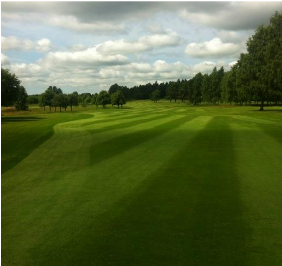
Fairway hål 14

I uppstarten lade vi en lite större giva än normalt med NPK (1000kg). När det återstod ca fyra veckor kvar fram till tävlingen lade vi en giva med lite finare gödning som är mer långtidsverkande. Resultat blev att vi fick ihop våra skador och kunde presentera riktigt fina slagytor ifrån fairway. Vid klippning användes två LF50 klippare från Jakobsen med greenaggregat och givetvis var dessa nyslipade inför tävlingen.