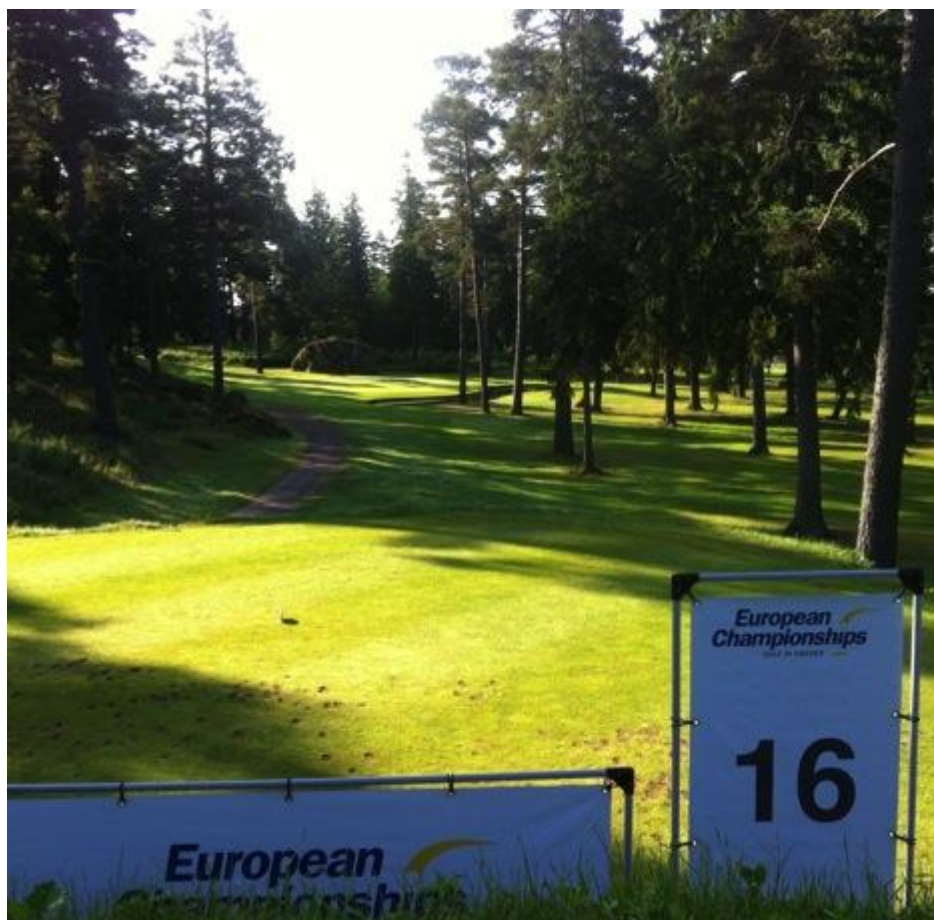
Tee håll 16

Vi hade i stort sett samma tillvägagångssätt på våra foregreens, förutom att dem kunde vi inte stänga av. Fyra veckor innan tävling så la vi en 0.15 giva med 13 kg Fe, för att senare göra samma procedur veckan innan tävlingsstart.