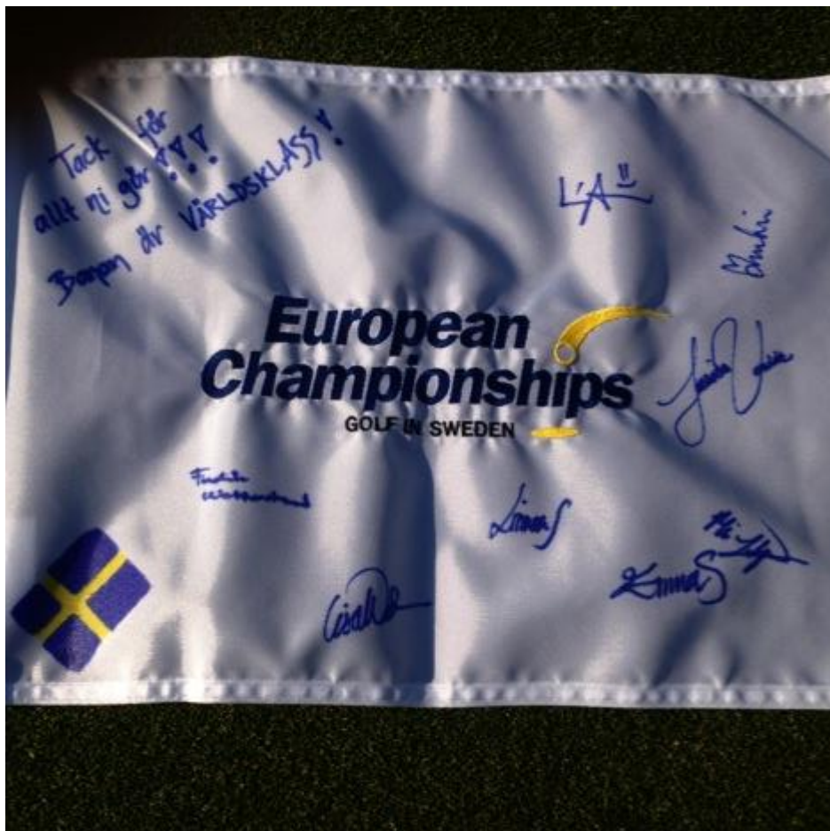
Signerad flagga från svenska laget

I vårt fall handlade det mest om att se till att vi fick ihop våra skador till samma nivå som yterna som klarat sig och sedan hålla detta på en hög nivå. Jag skulle vilja säga att ytor som fairway, tee, foregreen, ruff och semiruff klipps oftare ett par veckor innan tävlingen drar igång och även under själva tävlingen. Dels för att inte riskera att hamna efter i händelse av sämre väder som kan leda till att du kanske inte kan klippa alls, och dels för att standarden på dessa spelytor ska vara så hög som det bara går. Den största skillnaden mot vanlig skötsel är enligt min mening skötseln av greenerna. Här blir det en lite annan gödselstrategi än vanligt och en högre intensitet av skärning och dressning för att hitta en jämn och bra bollrull som också är tillräckligt snabb för elitgolfaren. Man skulle kunna sammanfatta det med att det blir lite mer av allt som du gör i vanliga fall.